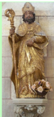
Statue du XVII ème de St Eutrope