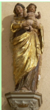
Vierge à l'enfant du XVIII ème

Cette église a été construite à la fin du XIX ème siècle dans un style néo-gothique. Des vitraux de belle facture appellent à la contemplation.