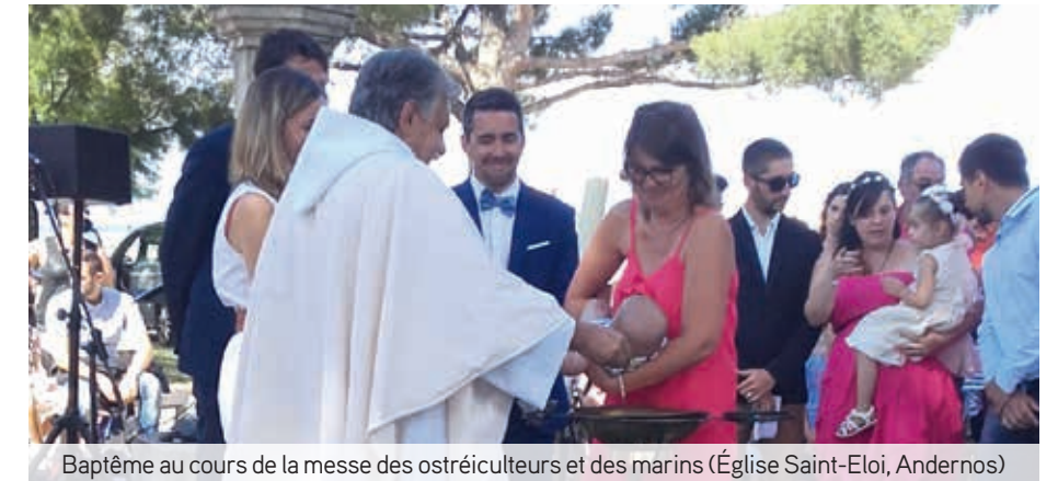
Baptême au cours de la messe des ostréiculteurs et des marins (Église Saint-Eloi, Andernos)

C'est avec un élan commun que nous animons les secteurs pastoraux de notre diocèse de Bordeaux : laïcs baptisés, évêques, prêtres et diacres, nous sommes tous au service du peuple confié pour notre mission : annoncer Jésus Christ au monde.