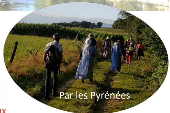
Par les Pyrénées

PÈLERINS DE L'IMMACULÉE - 33000 Bordeaux - assopelim@gmail.com - 07 80 16 83 95