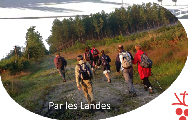
Par les Landes