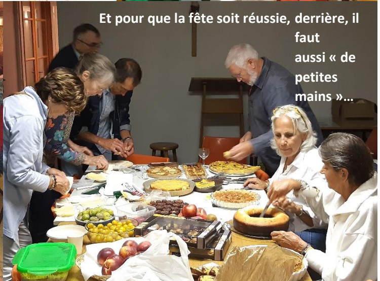
Et pour que la fête soit réussie, derrière, il faut aussi « de petites mains »...

Sites Internet utiles : Diocèse de Bordeaux : http://bordeaux.catholique.fr/ Secteur pastoral : http://catholegeares.fr Adresses courriel utiles : Secrétariat du Secteur : secteur.pastoral.lege.ares@wanadoo.fr Paroisse de Saumos : andreivr@orange.fr et/ou chantalivr@orange.fr