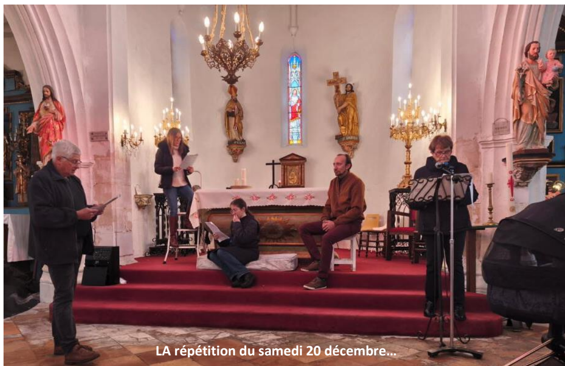
LA répétition du samedi 20 décembre...

Cette Veillée de Noël que j'avais rêvée seul et que j'avais rédigée seul me posa vite un problème majeur : la disponibilité des acteurs pour des répétitions... Sans la disponibilité des acteurs pour faire des répétitions, mon rêve tombait à l'eau ! Une seule fin de matinée, avec deux répétitions (une de découverte, et une de véritable action) purent avoir lieu, le samedi précédant Noël. Nous allions donc travailler sans filet, le jour « J ». Je n'avais plus le choix, il fallait y aller. J'avais eu la présence d'esprit de prévoir une régisseuse dont je