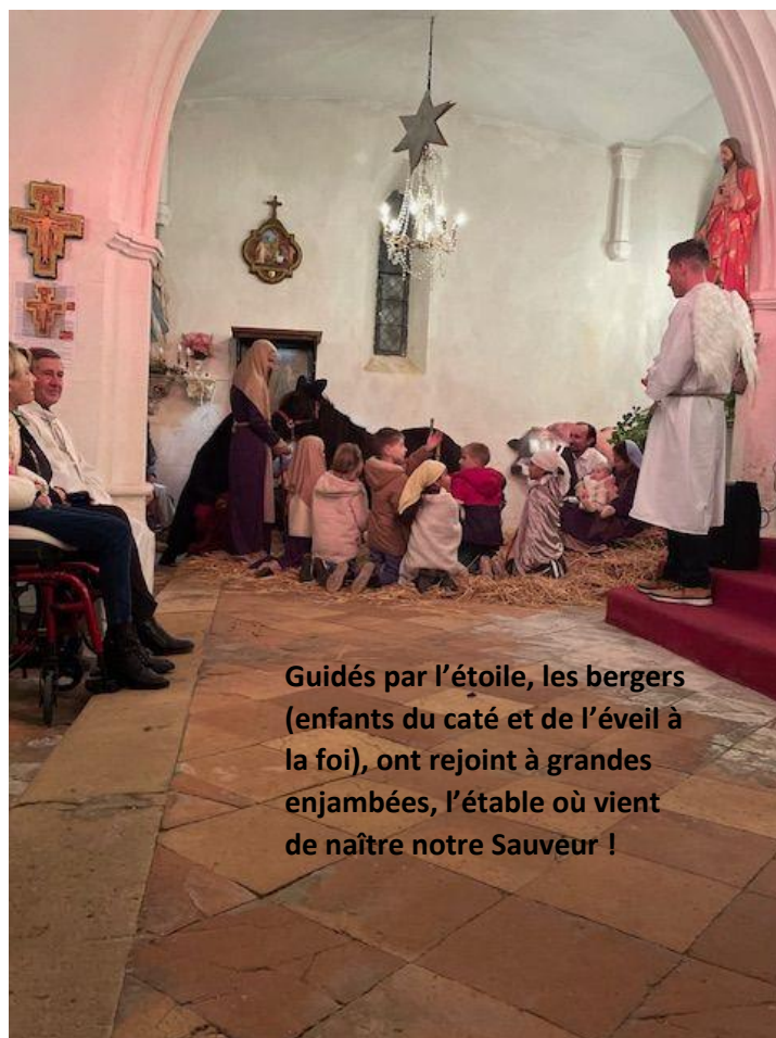
Guidés par l'étoile, les bergers (enfants du caté et de l'éveil à la foi), ont rejoint à grandes enjambées, l'étable où vient de naître notre Sauveur !

Sites Internet utiles : Diocèse de Bordeaux : Secteur pastoral : Adresses courriel utiles : Secrétariat du Secteur : Paroisse de Saumos :